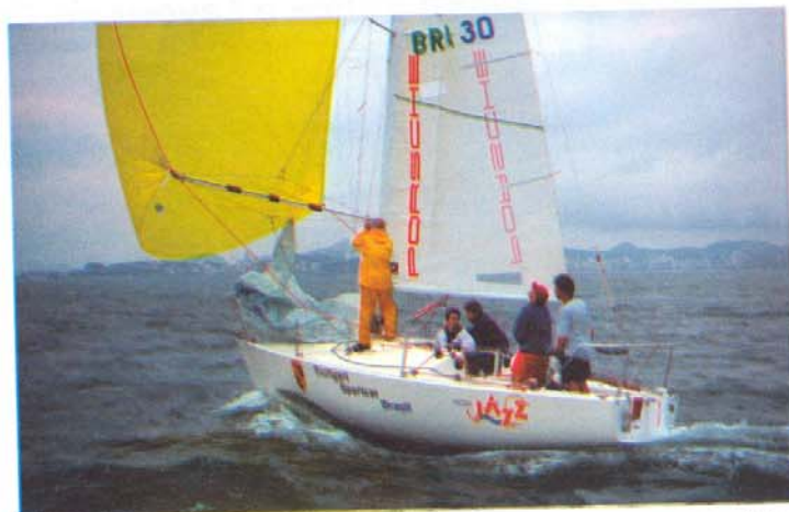
A maquininha de regatas em ação.

classes e que, muitas vezes, desestimulam os donos dos barcos, que são alijados da competição pelas estrelas convidadas para timonear os barcos nos campeonatos. Com a regra das 10 regatas, vários bons velejadores passaram a participar regularmente das regatas na Classe. A regra foi revogada somente em 1989.